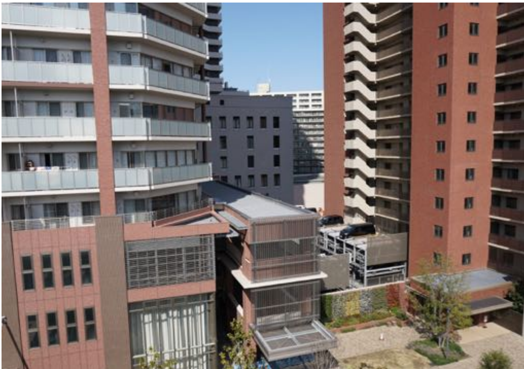
●enoco も含む再開発エリアの景色。enoco 屋上から撮影。両脇のタワーがマンション、奥が2018年5月オープンの日生病院。enoco スタッフで近代建築の専門家でもある高岡伸一さんにこのエリアや大阪での再開発に関する話を伺った。