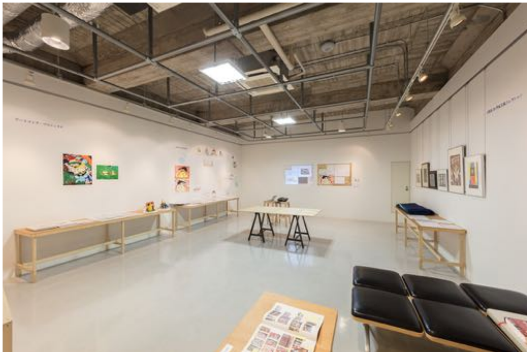
●enoco4 階ルーム 2 に最終報告会のためのスペースを設営。*