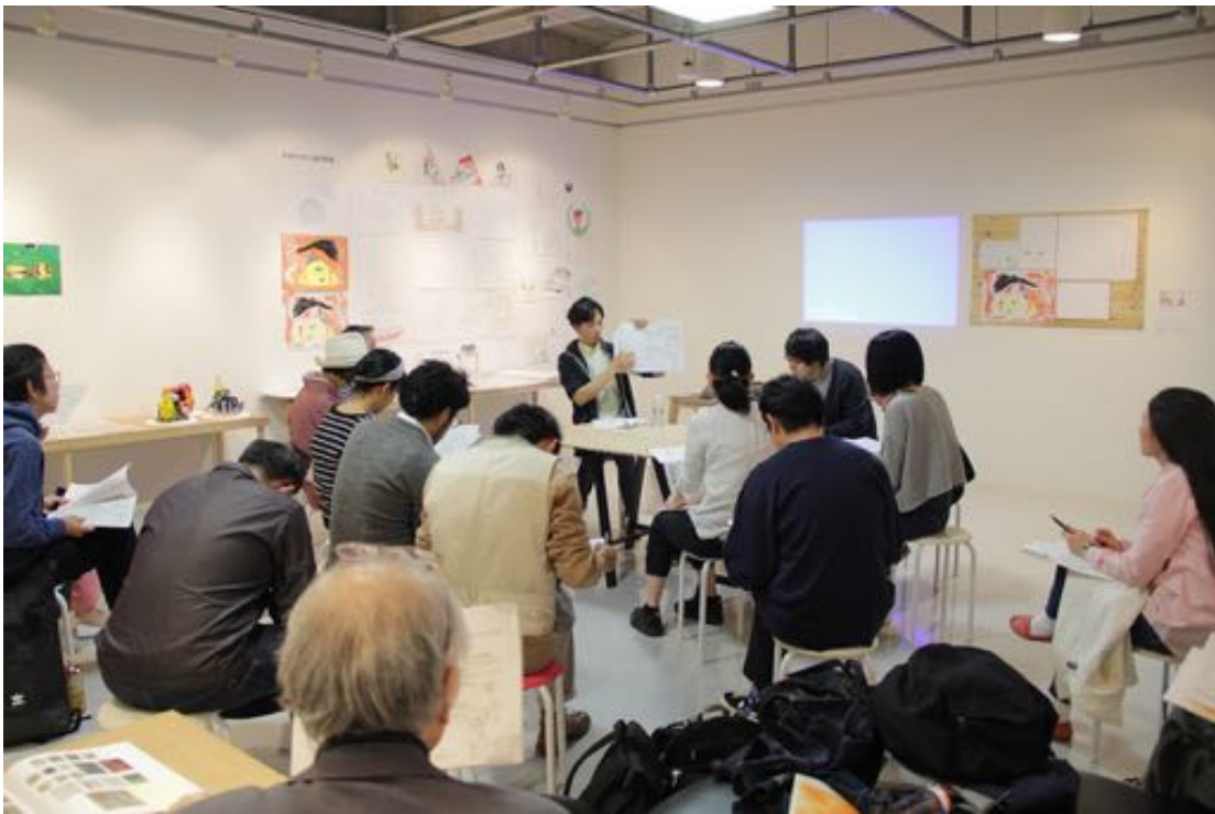
●最終報告会の様子。空間に用意した各資料を指差し確認し、意見のやりとりを行う中でリサーチの全体像を共有していく。