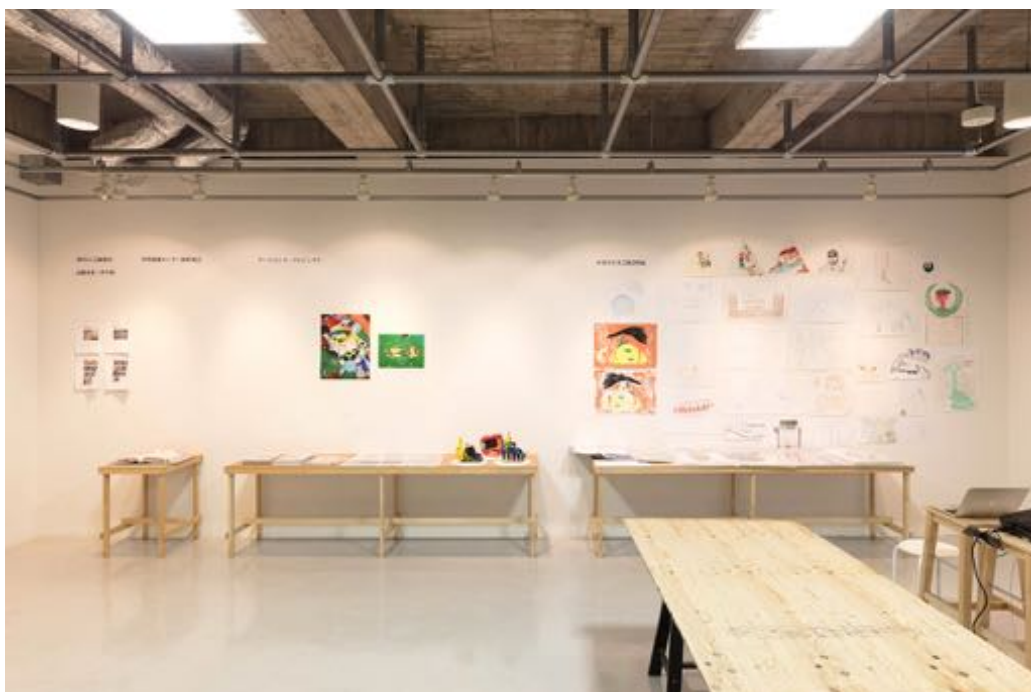
●左から、works(=)documents pdf 資料より「高槻市第三中学校」「芸術教室 ARTCA」の資料、「非常勤として勤務先の福祉施設」の記録ファイル、これまでプロジェクトで関わった「アートリンク・プロジェクト」と「ひと花プロジェクト(かまがさき芸術資料庵)」の作品と資料の一部。向かい側の壁の「大阪府 20 世紀美術コレクション」と合わせ、各地