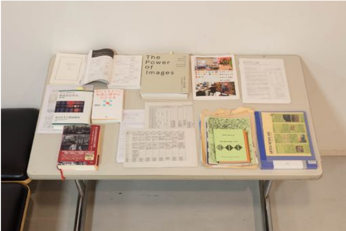
●最終報告会の会場角に置いた参考資料。報告会中に参照できるよう、これら一部の資料をもう一室[アトリエ=資料室]から持ち込んだ。*