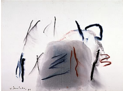
漢 - 1989年 - 油彩・キャンパス

この機会に、津高和一がその生涯をとおして追求し続けた抽象絵画の世界を体感いただければ幸いです。