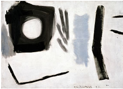
作品 - 1954年 - 油彩・キャンパス

トップ >> イベント >> 大阪府20世紀美術コレクション 津高和一 展 ～抽象のエスプリ～