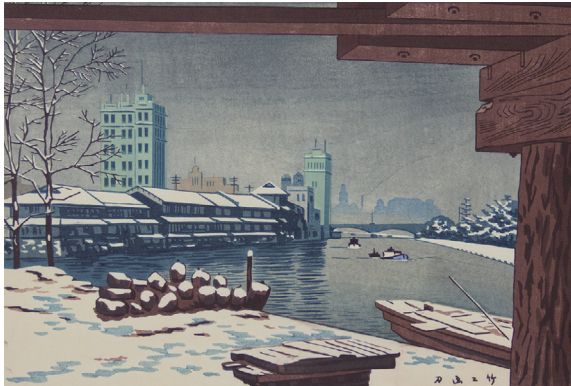
④ 《新大阪風景 北浜雪景》1932年