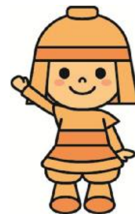
高槻市マスコットキャラクター はにたん