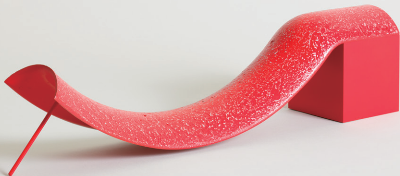
清水九兵衛《MASK-81》1988年 | アルミニウム・塗料 | 14.5×60.0×11.0 cm