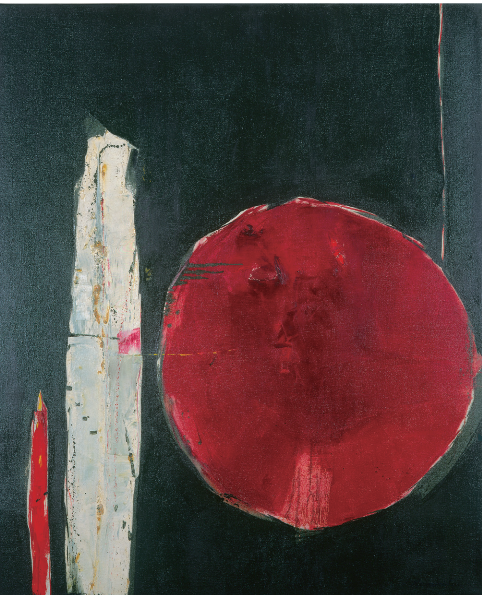
金光松美《無題 560》1956年 | アクリル・キャンバス | 153.0×127.0 cm