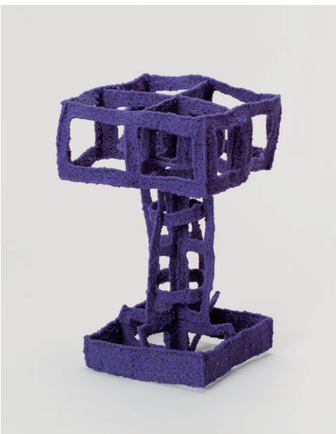
上： 吉原治良《作品》1965年頃 | 油彩・布 | 163.0×130.0 cm