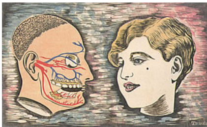
美女と野獣 リノカット紙 280x460mm 大阪府蔵 1930年