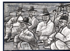
《鎮海山に鎮座する大徳寺の僧侶》1977年