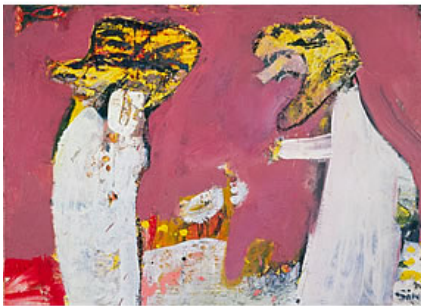
二人 1985年 油彩・カンヴァス