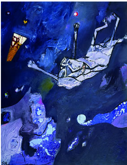
新狭 1983年 油彩・カンヴァス