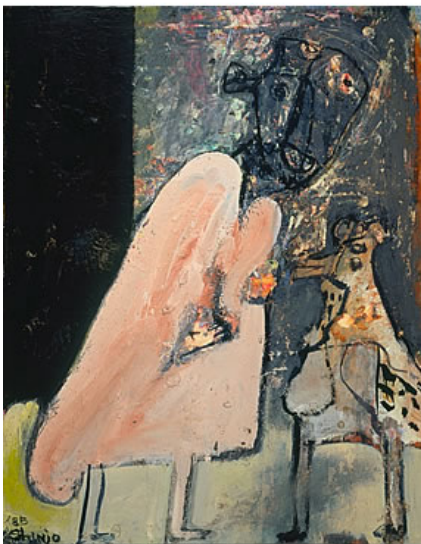
鳥と男 1985年 油彩・カンヴァス